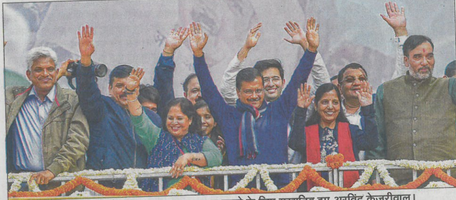
चुनाव नतीजों के बाद जनता का धन्यवाद करने के लिए मुखातिब हुए अरविंद केजरीवाल।